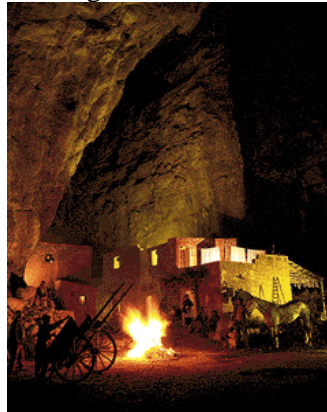
Cena e pernottamento in hotel